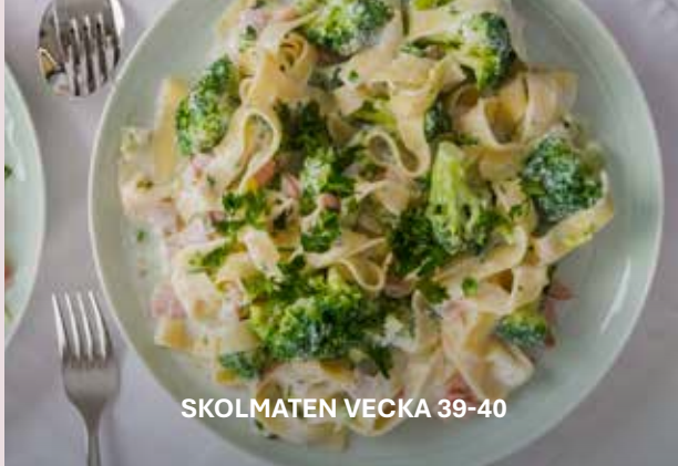
SKOLMATEN VECKA 39-40