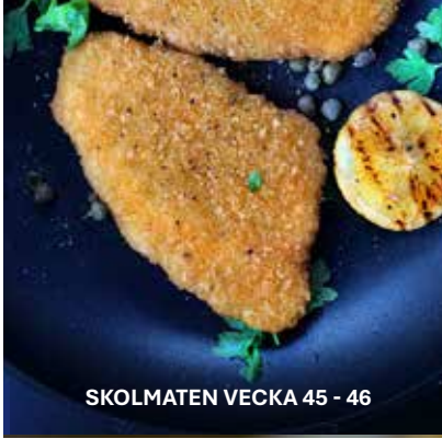
SKOLMATEN VECKA 45 - 46